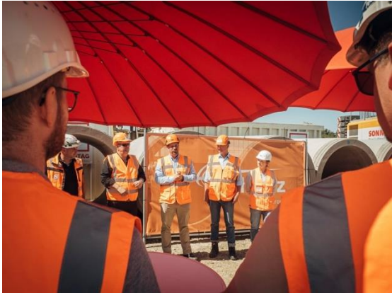
Feierlicher Startschuss für den Tunnelbau

Unten im Schacht ist es nun soweit: Mit den „Worten Glück auf!“ zerschellt die Flasche Schaumwein an dem massiven Bohrkopf, von oben kommen lauter Applaus und Jubelrufe. Die Freude, dass der Tunnelbau nun bald beginnt, ist groß.