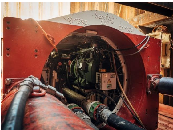
Startklar - Blick ins Innere der Tunnelbohrmaschine